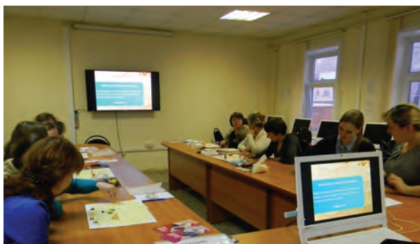
Рис. 1. Занятие по песочной терапии. Работа в парах.

Обучающиеся курсов: педагоги - психологи ДОО и школ, социальные педагоги, воспитатели групп продлённого дня или пришкольных интернатов, классные руководители и другие категории слушателей с интересом выполняют упражнения, где используется песок (в условиях курсов - манка). «Здравствуй, песок!», «Проекция» (Кто Я?) [1, с.128], «Рисование песком», «Расскажи историю», «Узор на песке», «Песочная мандала» и другие. Упражнения выполняются как самостоятельно, так и в паре, в группе. В ходе выполнения упражнений можно взаимодействовать, договариваться, тем самым развивая коммуникативные навыки (Рис.1).