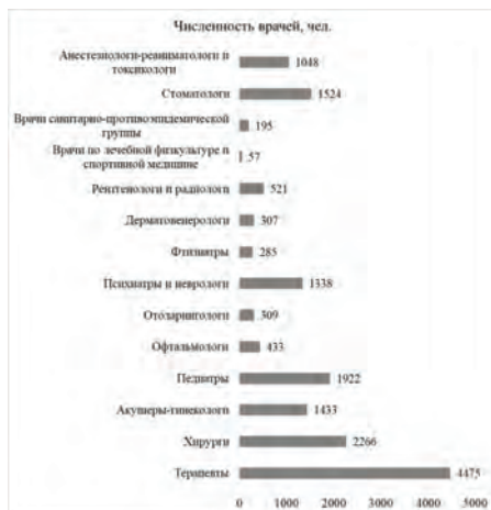
Рисунок 4 - Распределение числа врачей Краснодарского края по медицинским направлениям в системе Минздрава России за 2019 год (составлено по материалам [5])

На рисунке 4 показано распределение числа врачей по медицинским направлениям за 2019 год.