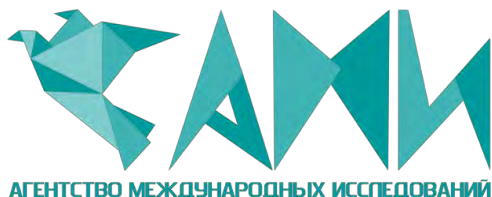
График Международных и Всероссийских научно-практических конференций, проводимых Агентством международных исследований представлен на сайте https://ami.im

С уважением, Оргкомитет https://ami.im || conf@ami.im || +7 967 7 883 883 || +7 347 29 88 999