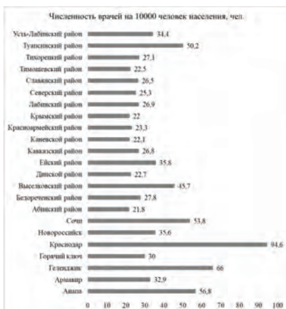
Рисунок 7 – Обеспеченность населения Краснодарского края врачами по медицинским направлениям за 2019 год в разрезе отдельных городских округов и районных поселений (составлено по материалам [5])

На рисунке 7 представлена обеспеченность населения Краснодарского края врачами по медицинским направлениям за 2019 год в разрезе отдельных городских округов и районных поселений.