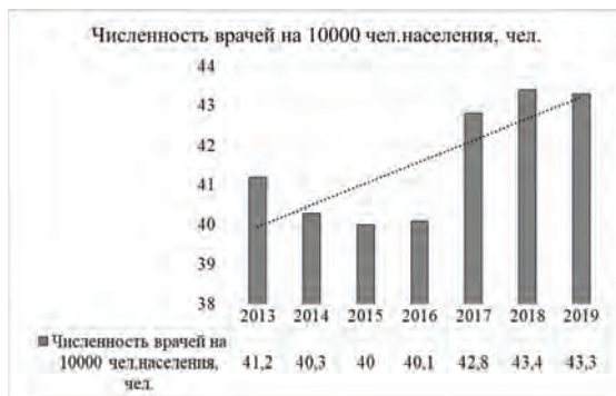
Рисунок 2 - Обеспеченность населения врачами Краснодарского края за период 2013 - 2019 гг. (составлено по материалам [3 - 5])

Обеспеченность населения Краснодарского края врачами показана на рисунке 2.