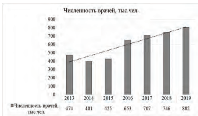
Рисунок 1 - Обеспеченность врачами Краснодарского края за период 2013 - 2019 гг. (составлено по материалам [3 - 5])

На рисунке 1 представлена обеспеченность врачами Краснодарского края за период 2013 - 2019 гг.