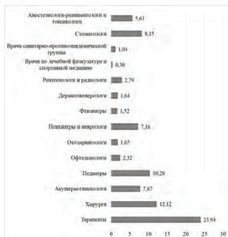
Рисунок 5 – Структура распределения врачей Краснодарского края по медицинским направлениям в системе Минздрава России за 2019 год (составлено по материалам [5])

На рисунке 5 показана структура распределения врачей по медицинским направлениям за 2019 год.