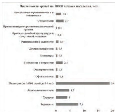
Рисунок 6 – Обеспеченность населения Краснодарского края врачами по отдельным медицинским направлениям за 2019 год (составлено по материалам [5])

На рисунке 6 показана обеспеченность населения Краснодарского края врачами по отдельным медицинским направлениям за 2019 год.