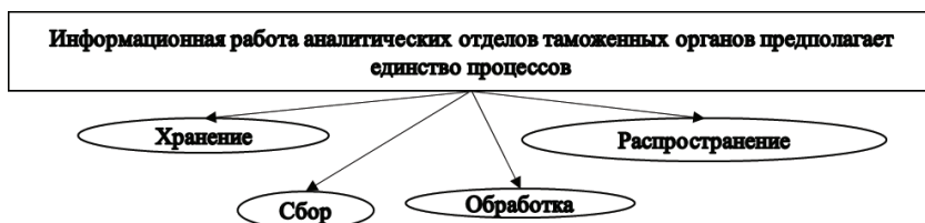
Рисунок 1. Единство процессов информационной работы аналитических отделов таможенных органов

Информационно - аналитическая работа - это процесс реализации конкретных действий, выполняемых в подразделениях таможенных органов для решения производственных проблем. Все без исключения таможенные службы собирают и анализируют информацию в пределах своей компетенции. [2]