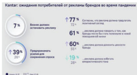
Рисунок 1. Ожидания потребителей от рекламы брендов во время пандемии [1]

Международное агентство маркетинговых исследований Kantar изучило, как изменилось настроение и поведение потребителей в период «самоизоляции».