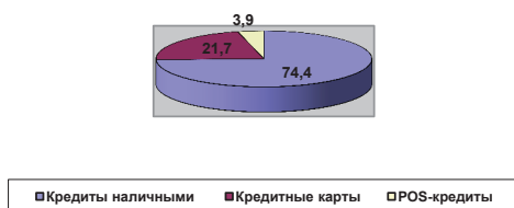
Рисунок 1 - Структура потребительских кредитов на 01.07.2019 г. с учётом видов кредитов (сегментов) в их составе, %

На рисунке 1 покажем структуру потребительских кредитов на 01.07.2019 г. с учётом этих видов (сегментов).