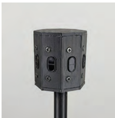
Рисунок 3 – Датчик обнаружения препятствий в сборе

С целью минимизации габаритов устройства первоначальная модель корпуса, разработанная в САПР „КОМПАС - 3D“, была оптимизирована в среде FreeCAD. Смещение сенсоров максимально близко к геометрическому центру с сохранением шага в 45° позволило полностью устранить „мертвые зоны“ за счет перекрытия смежных конусов обзора (рисунок 3). Финальный компактный корпус изготовлен методом 3D - печати; его технические параметры приведены в таблице 1.