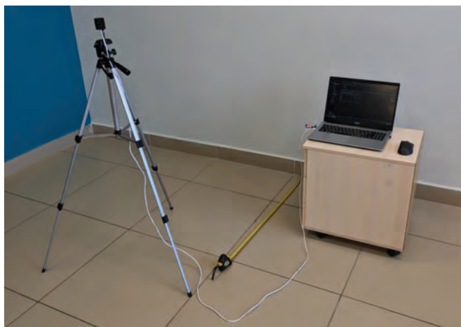
Рисунок 4 - Экспериментальная установка

Для оценки точностных и эксплуатационных характеристик готового прототипа был собран лабораторный экспериментальный стенд (рисунок 4). Датчик жестко фиксировался на лабораторном штативе, обеспечивающем прецизионную стабилизацию пространственного положения и регулировку высоты над уровнем пола. Питание и информационный обмен с регистрирующим ПК осуществлялись по интерфейсу USB Type - C в режиме эмуляции Virtual COM - порта (CDC). На стороне персонального компьютера было развернуто разработанное специализированное приложение на языке Python (рисунок 5).