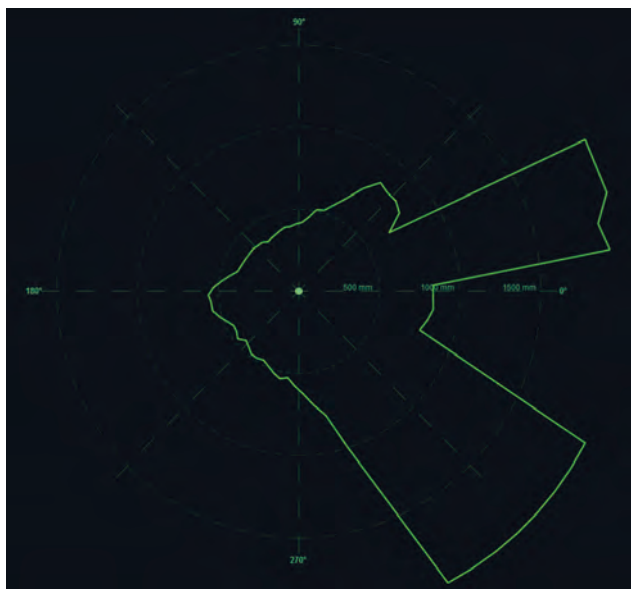
Рисунок 5 – Пример работы программы

Скрипт визуализации осуществлял парсинг строк, пересчитывал полярные координаты точек в декартовы с привязкой к азимутальному углу установки каждого ToF - модуля и строил замкнутую ломаную линию, отображающую текущую конфигурацию препятствий в реальном времени.