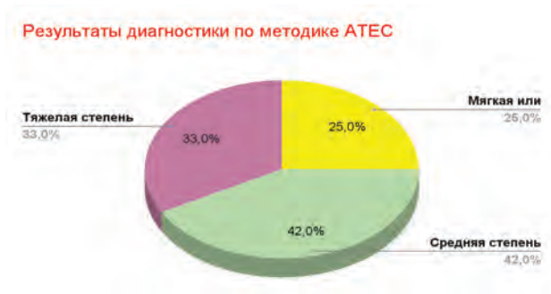
Рисунок. Результаты диагностики по методике АТЕС

Результаты сформированности коммуникативных навыков у детей дошкольного возраста с РАС по методике АТЕС: