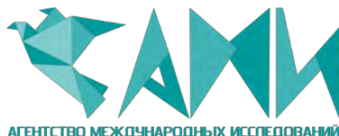
График Международных и Всероссийских научно-практических конференций, проводимых Агентством международных исследований представлен на сайте https://ami.im

Рассылка электронных вариантов в течение 7 рабочих дней после конференции