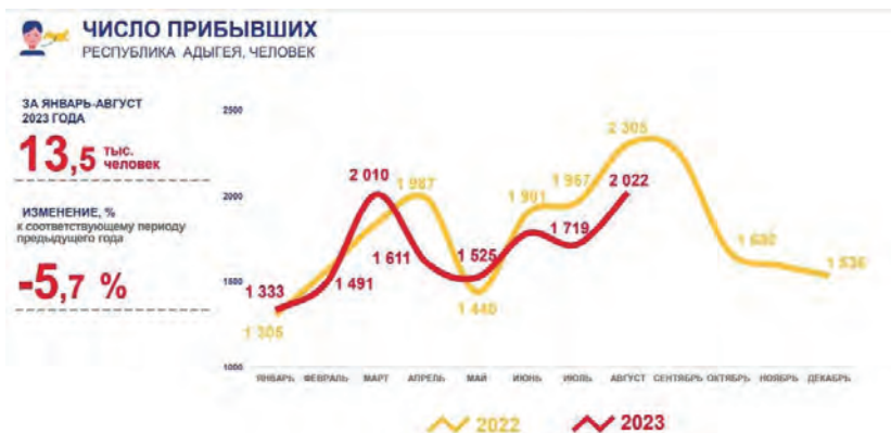
Рисунок 2. Количество прибывших в Республику Адыгея за январь - август 2023 г. по сравнению с этим же периодом 2022 г.

Это жители стран СНГ, стран дальнего зарубежья, лица, прибывшие в Адыгею в результате межрегиональной и внутрирегиональной миграции.