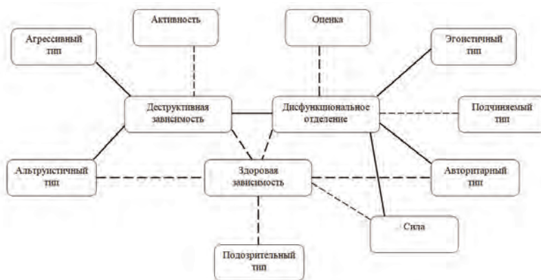
Рисунок №1. Корреляционные плеяды межличностной зависимости и образа брачного партнера

Помимо этого, выявлено, что все типы межличностной зависимости взаимосвязаны друг с другом. Так, формирование здоровой зависимости способствуют снижению деструктивной зависимости ( r = -0,561 ; p \leq 0,000 ) и дисфункционального отделения ( r = -0,614 ; p \leq 0,000 ). Тем временем, деструктивная зависимость коррелирует с дисфункциональным отделением ( r = 0,399 ; p \leq 0,002 ). Как было замечено ранее, формирование нормальной, здоровой привязанности снижает шансы развития отклоняющейся от нормы зависимости (дисфункциональное отделение, деструктивная зависимость). Таким образом, гипотеза о наличии взаимосвязи между типом межличностной зависимости и образом брачного партнера, подтверждена.