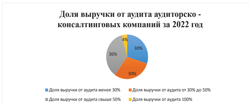
Рисунок 1 - Соотношение доли выручки только от аудита аудиторско - консалтинговых компаний за 2022 год

По данным рейтингового агентства RAEX, компании, попавшие в ранжирование самых крупнейших аудиторских фирм за 2022 и 2021 год в 100 % случаях, оказались компаниями, совмещавшими консалтинговую и аудиторскую деятельность. Данные исследования показали, что среди крупнейших аудиторских компаний 2022 года доля выручки только от одного аудита составляла лишь часть от объёма общей выручки, причём в большинстве случаев аудит от общего объёма выручки занимает не значительную её часть (рис.1).