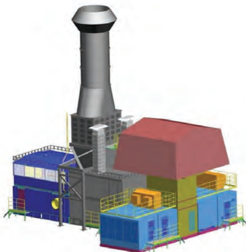
Рисунок 1 – ГПА - 25 мВт «Урал» блочно - контейнерного исполнения

Взамен установленных шести агрегатов ГПА - Ц - 16 предлагается установить три агрегата ГПА - 25 серии «Урал» (рис 1.).