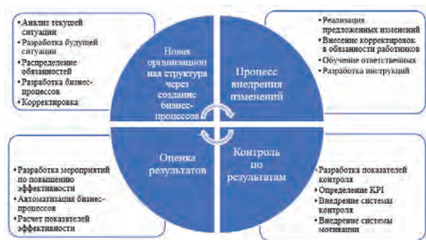
Рисунок 1 - Циклическая матрица процессного управления для эффективного бизнеса

Проведенный обзор публикаций, отражающих направление применения процессного подхода, позволил разработать циклическую матрицу процессного управления для повышения эффективности ведения бизнеса любой компании (рис. 1).