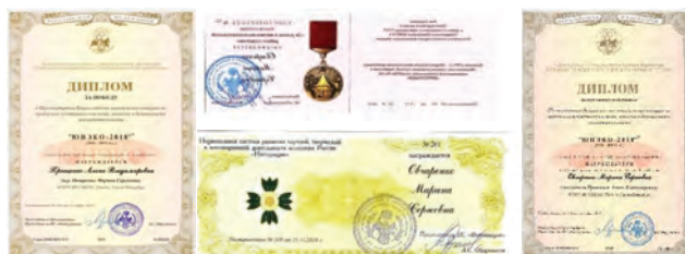
Рис. 4. Дипломы и знаки отличия «ЮНЭКО - 2018»

Участие в XVI Всероссийском молодежном конкурсе по проблемам культурного наследия, экологии и безопасности жизнедеятельности «ЮНЭКО - 2018» с научно - исследовательской работой: «Разработка и внедрение устройства, обеспечивающего безопасную эвакуацию детей при пожаре из здания детского дошкольного образовательного учреждения» отмечено двумя Дипломами, а также нагрудными знаками отличия «ЮНЭКО», «За успехи в научно - исследовательской работе студентов» (рис. 4).