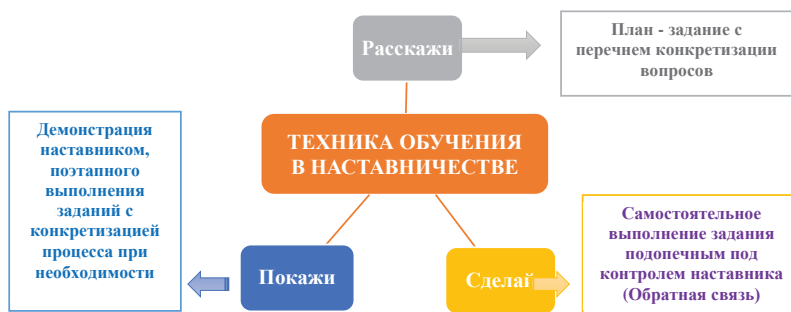
Рис. 2. Отечественная модель наставничества

Кроме этого, автором применялась отечественная технология наставничества в виде модели («Расскажи – Покажи – Сделай») (рис. 2).