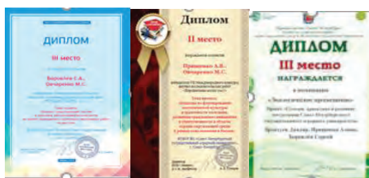
Рис. 3 Дипломы за участие в конкурсах

Участие в Международном конкурсе выпускных квалификационных и курсовых работ «Молодые лидеры – 2017» с научной работой на тему: «Анализ существующих систем и способов обеспечения безопасности во время проведения строительно - монтажных работ на высоте» отмечено Дипломом за 3 место (рис. 3). Дипломом за 2 место отмечено участие в VII Международном конкурсе научно - исследовательских работ «Перспективы науки – 2017» на тему проекта: «Результаты исследований условий труда педагогических работников и предложенные пути по их совершенствованию» (рис. 3). Участие в Конкурсе студенческих экологических проектов в номинации Экологическое просвещение на тему: «Созидая, продолжая и развивая студенческие Экотрадиции СПбГАУ» среди вузов Санкт - Петербурга отмечено Дипломом за 3 место (рис. 3).