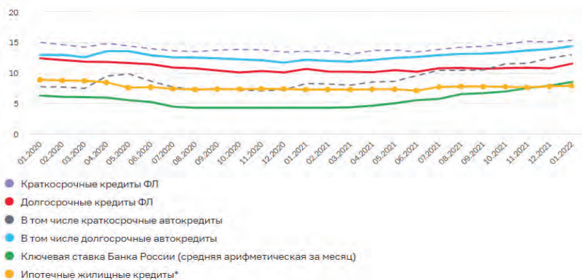
Рисунок 1. Динамика процентных ставок по кредитам физическим лицам (в том числе автокредитам) в рублях, % годовых

В сегменте кредитования физических лиц за последние два года нестабильности финансового сектора наблюдались значительные изменения по процентным ставкам в разрезе видов кредитов (рис. 1). Конечно, во многом это обусловлено изменением ключевой ставки Банка России (на 01.2020 - 6,25 % , на 01.2022 – 8,5 %) основного ориентира для установления ставки по кредитам банками.