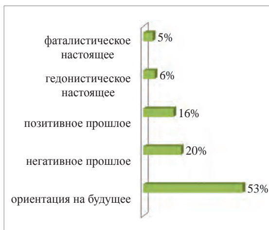
Рисунок – Структура временной перспективы юношей и девушек

Результаты опросника временной перспективы Ф. Зимбардо в адаптации А. Сырцовой, Е. Т. Соколовой, О. В. Митиной (ЗТРИ) показали, что большинство опрошенных юношей и девушек ориентированы на будущее (53 %) (см. рис.).